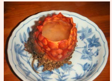
こぶりの天然物が一番

ホヤ徳利熱燗のできあがり三回くらいまでは殻が使えます。酒豪の皆さんは是非挑戦してみてください。美味！！