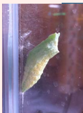
観察 6 :