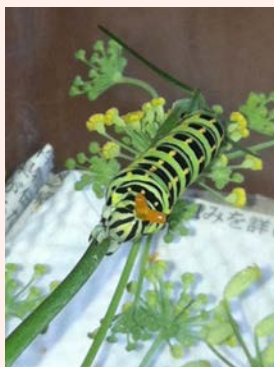
観察 2 :