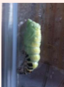
観察 5 :

サナギから二週間程でチョウチョになるとのことなので、もうすぐ綺麗な黄アゲハチョウチョになることなのでしょう。みなさまも、子供のころにかえて、夏休みの研究をしてみたらきっと心が癒されると思います。