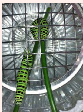
観察 3 :