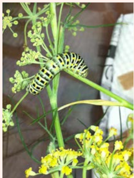
観察 1 :