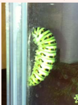
観察 4 :

■観察 1 : 庭から取ってきたフェネルの枝に二匹の黄アゲハの幼虫がついていたので、そのまま虫かごへ、夏休みの観察に娘たちに貢献しそうです。でも、観ているととっても、なごむ~(^^)