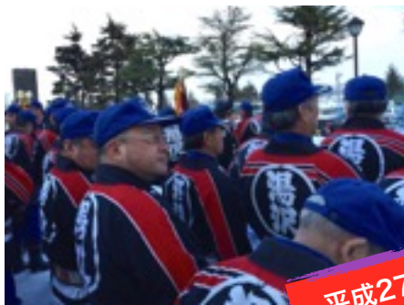
平成27年1月5日 出初め式