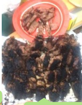
テキサス・ブリスケット