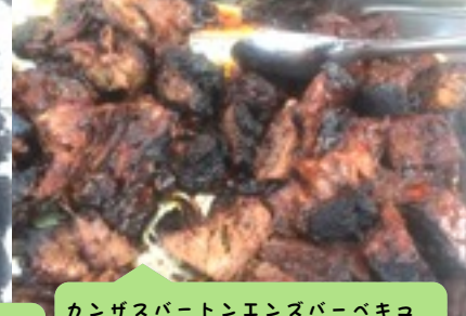
カンザスバーベキュー