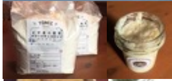
カブートサッコロツタイプ00