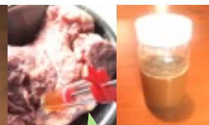
ブロンズインジェクション 注入