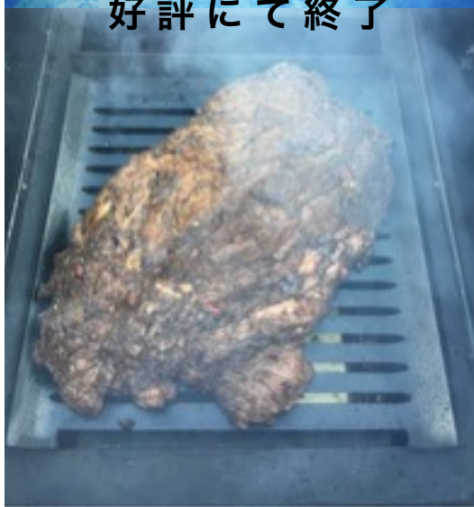
ブリスケット (ポイント) 3kg

「つながうう吹張」ということで、今年も「納涼祭」を開催することが出来ました。台風20号の接近で天気が心配でしたが、朝方の小雨も午後からはあがり準備をしました。午後4時からの開催ということでしたので、朝5時にはメインも3kgのお肉のために窯に薪を焚きました。午後5時頃には町内の皆様も集まりだしテントの中での懇親会が始まりました。前日仕込みのピザ生地にも旬の野菜とピザも焼きました。皆様の話もありあがり最高の懇親会となりました。お肉も思い通りの柔らかさと味付けになり、皆様には大変満足して頂いたようでした。