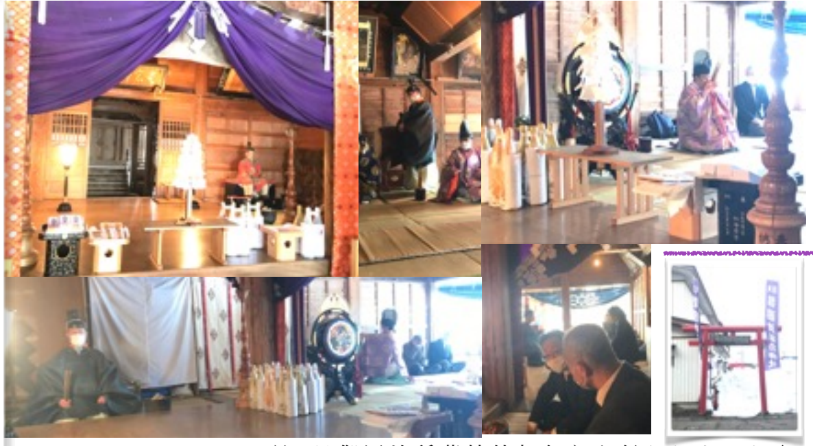
3月1日御囲地稲荷神社初祭りも行われました↑